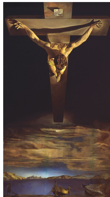
Christ of Saint John of the Cross – Salvador Dalí

Troubled souls why will you scatter like a crowd of frightened sheep? Foolish hearts why will you wander from a Love so true and deep? There is hope in deepest midnight, in the garden of despair. There's a light that comes with morning, when the mourning's hard to bear.