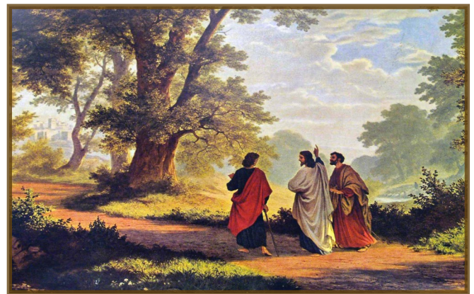
Der Gang nach Emmaus (The Road to Emmaus), Robert Zund

I live within You. Deep in Your heart, O Love. I live within You. Rest now in me.