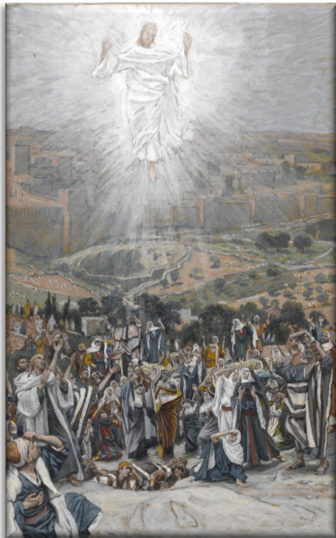
The Ascension (L'Ascension) James Tissot Brooklyn Museum