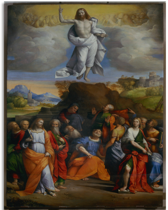
The Ascension of the Lord Garofalo 1510-1520

Fill us up and send us out, fill us up and send us out Fill us up and send us out Lord