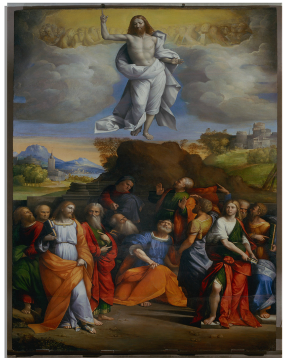
La Ascensión del Señor, Garofalo

El Señor nuestro Dios ha resucitado. (2)