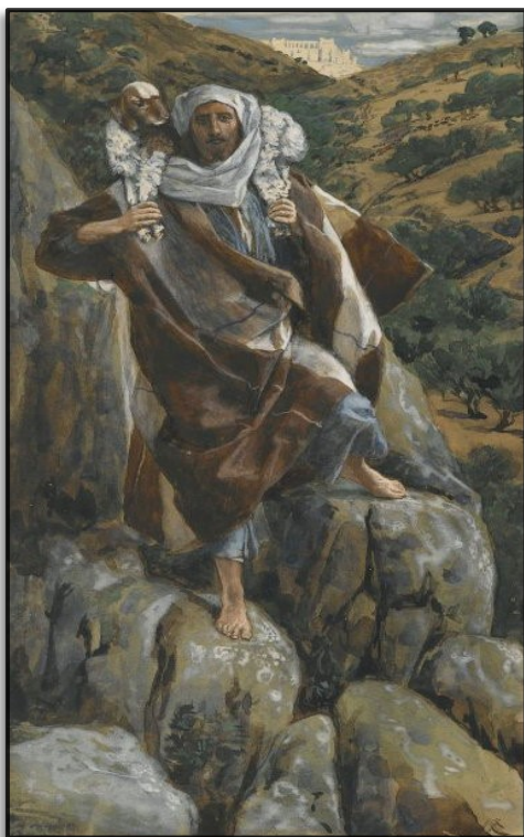
Le bon pasteur, James Tissot, Brooklyn Museum