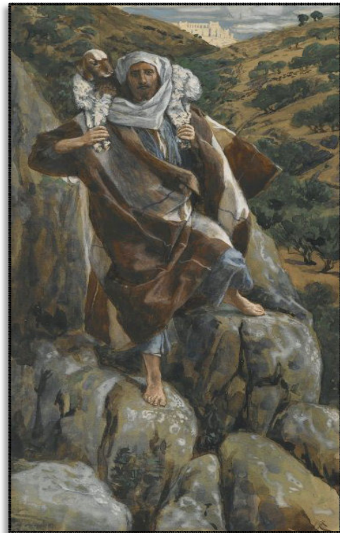
Le bon pasteur, James Tissot, Brooklyn Museum

You're lighting up my future, You're lighting up my faith You're lighting up my wonder with endless grace You're lighting up my failure, You're lighting up my fears Everything I've carried over all these years